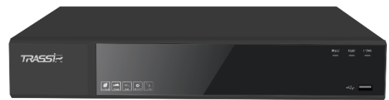
TR-N1216 / TR-N1216P

TRASSIR TR-N1108 / 1108P / 1216 / 1216P – сетевые видеорегистраторы для построения систем видеонаблюдения на базе IP-камер. Запись, воспроизведение и отображение до 16 каналов в разрешении до 4K.